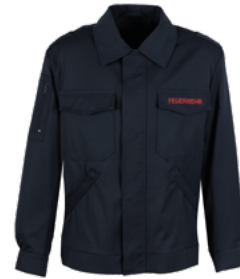
Blouson Spark Artikel-Nr. 312413 / UVP 203,70*

dunkelblau, Stick FEUERWEHR in rot, mit Schultertunnel, Obermaterial: 99% Euramid® Pro/1% Belltron® Antistatik mit FC Ausrüstung, Innenfutter: 100% Baumwolle, Zertifizierung: EN ISO 11612:2015-11 A1, A2, B1, C1: Schutzkleidung – Kleidung zum Schutz gegen Hitze und Flammen // EN 1149-5:2018: Schutzkleidung – elektrostatische Eigenschaften Lieferbare Größen: 20/21–36/37, 40/42–68/70, 88/90–118/122