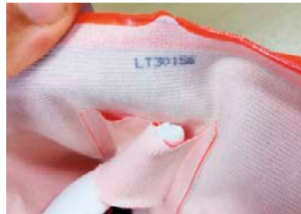
Bild 2: Chargennummer unterhalb der Kordel